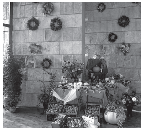
Geschmückter Kirchenraum in Copitz

Am 25. September sind alle herzlich eingeladen ins Kirchgemeindezentrum Pirna-Copitz zum Kranzbinden. 9 Uhr wollen wir beginnen und wie immer mit einem kleinen Imbiss die Aktion beenden. Erntegaben können an diesem Tag bis 14 Uhr im Kirchgemeindezentrum abgegeben werden. Die Erntegaben werden wir wieder an die Pirnaer Tafel weitergeben.