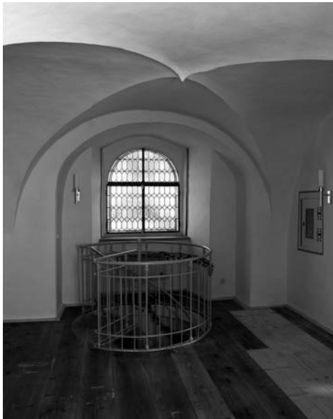
Auf der Empore entstand ein hübscher Gemeinderaum

zur sanierten Stadtkirche St. Marien und dem modernen Kirchgemeindezentrum in Copitz. Damit rückt die Schlosskirche wieder näher ins Blickfeld. Der Blick aber ist noch suchend. Suchend nach einem Profil, einer Nutzungskonzeption. Selbstverständlich ist eine Kirche in erster Linie der Raum für Glaube und Gebet, wir hören Gottes Wort, singen, feiern, wir erfahren Gemeinschaft. Doch 14-tägige Gottesdienste mit überschaubarer Besucherzahl werfen die Frage nach weiteren Ideen auf, der so wunderbar sanierten Kirche mehr Leben einzuhauchen. Gerade der neu entstandene Gemeinderaum in der Loge könnte Ort der Begegnung innerhalb der Dorfgemeinschaft werden bzw. könnten sich hier Pirnaer Konfirmanden treffen oder das Krippenspiel geprobt werden. Die Jahn-Orgel wurde ebenfalls überholt und sogar eher als geplant wiedereingebaut. So könnte auch zu mehr musikalischen