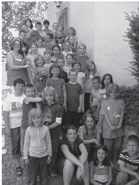
Viel Spaß gab's zur Kinderrüstzeit in Zehren

führen wir am Dienstag ins Schwimmbad nach Lommatzsch. Am Mittwoch sind wir, passend zum Thema, in den Tierpark Hebelei gewandert. Neben den Tieren war die Matschstrecke ein großer Anziehungspunkt. Wir haben am Donnerstag eine Wanderung zur Klosterruine zum Heiligen Kreuz nach Meißen gemacht. Dort erfuhren wir etwas über den Weg der Bio- und Supermarktmilch. In der Freizeit gab es Möglichkeiten zum Spielen in dem großen Gelände, außerdem wurde gebastelt und beim Filme-Anschauen gab es Zeit zum Entspannen von der großen Hitze im und ums Haus. Natürlich wurde am Sonnabend von einigen