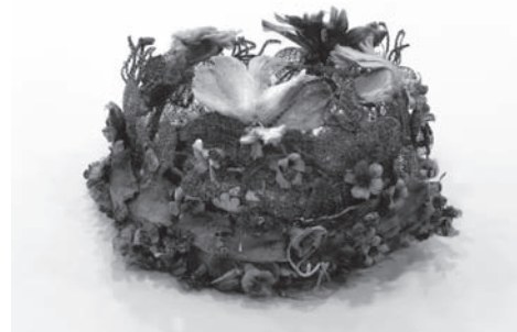
Totenkronen aus der Gruft der Klosterkirche Riesa

Die sehenswerte Ausstellung über den längst vergessenen Totenkronenbrauch beim Ledigenbegräbnis entdeckte ich im Foyer eines Berliner Bestattungsunternehmens. Nachdem