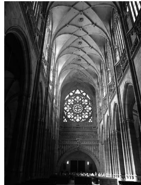
Nach Schneeberg und Marienberg (2003), Most und Ossek (2004), Wittenberg und Leisnig (2005), Großenhain und Jüterbog (2006), Chemnitz und Ebersdorf (2007), Halle (2008), Luckau und Fürstlich Drehna (2009) ging die Exkursion des Fördervereins in diesem Jahr nach Prag (Bild oben: Veitsdom)