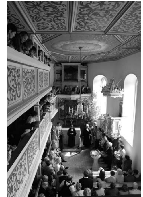
»Reich gefüllt« war die Schlosskirche Zuschendorf zur Wiedereinweihung am Pfingstmontag

Diese sehr treffende Aussage war am Pfingstmontag zur feierlichen Wiedereinweihung der Zuschendorfer Schlosskirche zu hören. Und wahrlich: betreten wir das Innere, empfängt uns ein in Proportion und Farbgebung gelungener sanierter Kirchenraum. Das strahlend Helle an Wänden und Emporen fängt die illusionistische Marmorierung ab, kombiniert mit typisch floralen Elementen des Barock. Der Blick lenkt zum ebenfalls renovierten Flügelaltar – eine Kostbarkeit aus der Schule Cranachs. Die letzten beiden Jahre haben die Dorfkirche zum Schmuckkästchen werden lassen. Und nun reiht sich Zuschendorf stolz in das »Dreigestirn« der Pirnaer Kirchen ein;