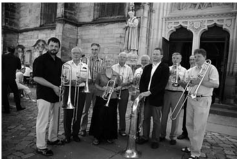
465 Jahre Stadtpeiferei – wahrlich ein Grund zum Feiern!